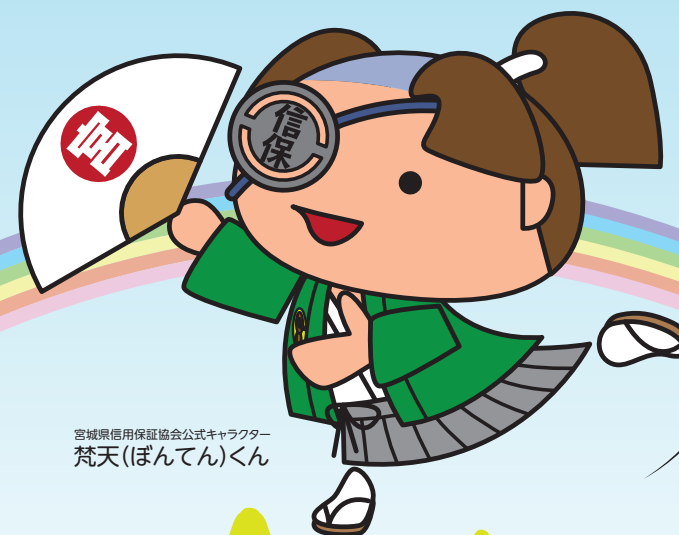
宮城県信用保証協会公式キャラクター 梵天(ぼんてん)くん

信用保証協会は中小企業・小規模事業者の 金融円滑化のために設立された公的機関です。