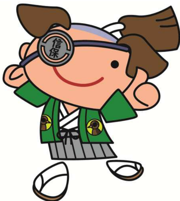
宮城県信用保証協会マスコットキャラクター 「梵天くん」

宮城県信用保証協会は、創業にチャレンジする 皆さまを「金融支援」と「経営支援」で応援します！